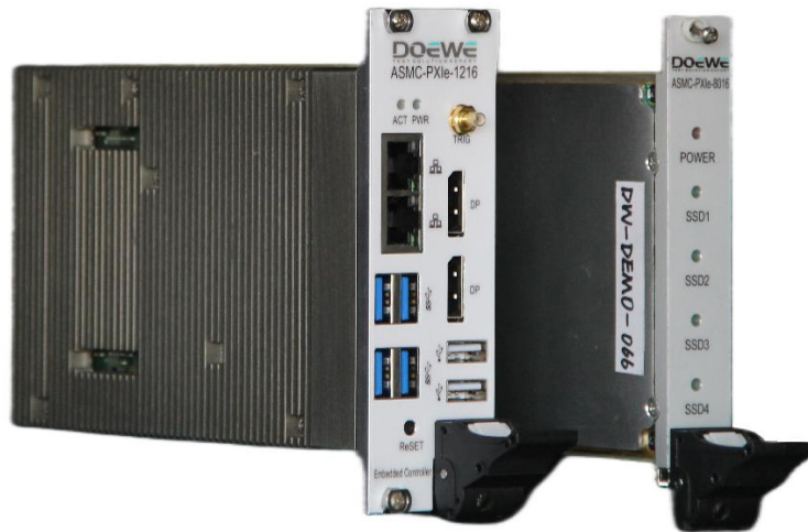
图 3 数据采集板卡

度纬科技提出的基于数采系统的具有电容特性材料动态充放电特性测试解决方案，能够精确模拟材料在幅度值和频率变化条件下的充放电行为，从而全面评估其电容性能。通过该方案的实施，可以在多变的工作环境中，特别是不同信号幅度和频率的影响下，深入了解材料的充放电特性。这为材料的设计优化、性能提升和应用提供了可靠的数据支持。